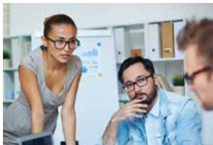
بيانات | بيئة ودية