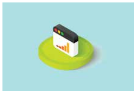
طلب | إعلان إبداعي