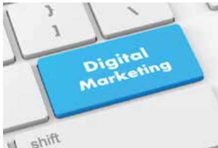
الإعلانات | استشارات الأعمال

في عالم اليوم ، يتضمن النجاح بناء علامة تجارية ترتبط بأعمالها.