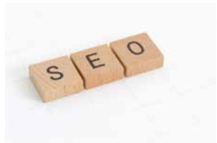
برنامج | إدارة وسائل الإعلام