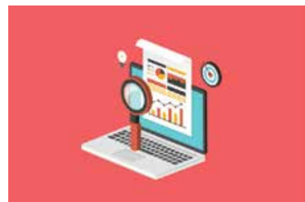
إدارة | العلاقات العامة