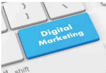
Marketing | Event Management